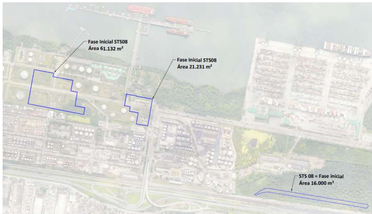
Figura 2. 1ª Etapa de transição do STS08

A figura a seguir demonstra a 1ª Etapa de transição do Terminal, com 3 anos de duração.